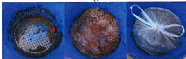
Einblick: Hasendraht, Gardine und sandgefüllter Müllbeutel