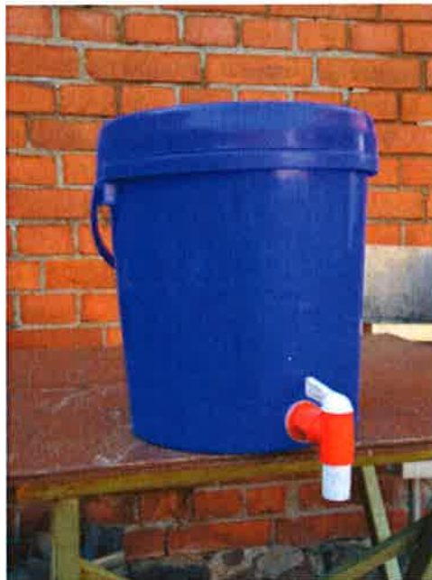
der fertige Eimer